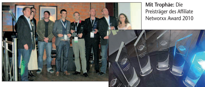
Mit Trophäe: Die Preisträger des Affiliate Network Awards 2010