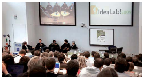
Diskussion großgeschrieben: Beim Idea Lab 2009 in Berlin kamen potenzielle Gründer und Investoren ins Gespräch